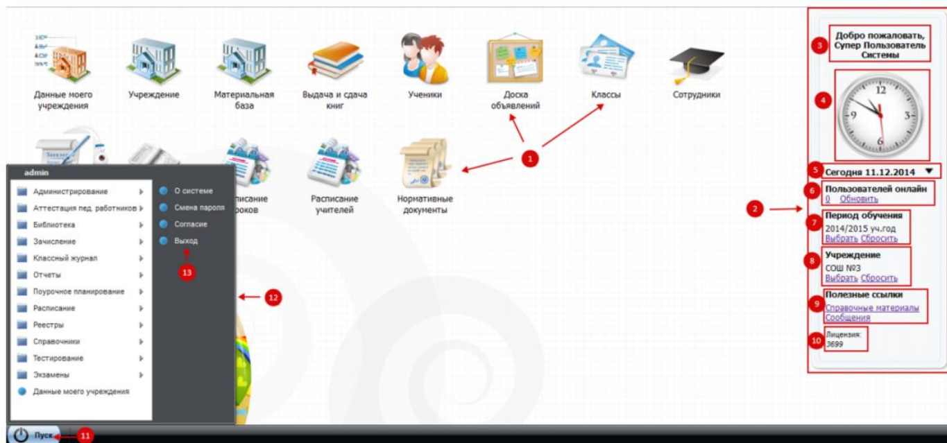
Рис. 4.6. Рабочий стол Системы.

1 – ярлыки рабочих форм; 2 – виджеты Системы; 3 – виджет Приветствие; 4 – виджет Часы; 5 – виджет Календарь общегородских событий; 6 – виджет «Пользователи онлайн»; 7 – фильтр «Период обучения»; 8 – фильтр «Учреждение»; 9 – виджет «Полезные ссылки»; 10 – номер лицензии; 11 – меню Пуск; 12 – список меню Пуск; 13 – кнопка Выход.